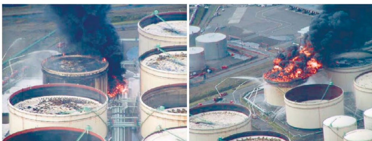
Рисунок 2 — Пожар на нефтяных резервуарах при землетрясении Ниигата

Множество повреждений было вызвано разжижением песчаных переувлажнённых грунтов при вибрации. Конструкции, расположенные на таком грунте, погружаются в песок, а подземные, наоборот, «всплывают» на поверхность. Разжижение грунта привело к неоднородной осадке основания резервуаров, что вызвало деформации подводящих трубопроводов. Грунтовые воды вышли на поверхность и смешались с морской водой, принесенной цунами, и нефтью, разлившейся через поврежденные трубопроводы и конструкции резервуаров, что привело к быстрому распространению огня по всей территории склада. Также цунами сместило резервуары объемом менее 500 м 3 .