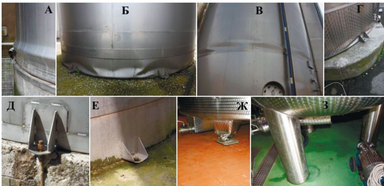
Рисунок 3 — Повреждения резервуаров при землетрясении Эмилия. а – «слоновья нога», б, в, г – ромбовидная потеря устойчивости, г, д, е – повреждение анкерных конструкций, ж – потеря устойчивости опоры, з – проскальзывание незакрепленного резервуара

Как видно из представленных выше данных, аварии резервуаров при воздействии землетрясений могут повлечь многочисленные человеческие жертвы и серьезные экономические последствия.